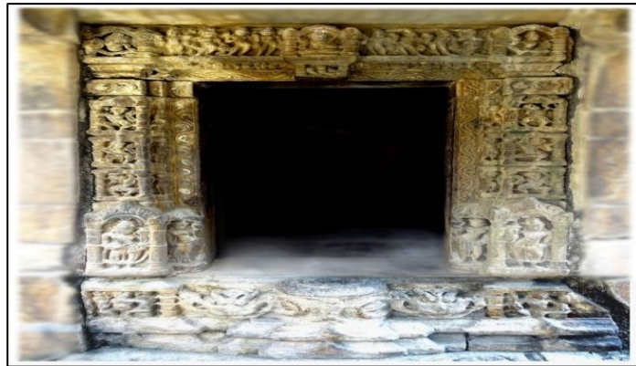
चित्र संख्या ८- आदिबदरी मंदिर समूह के गणेश मंदिर की सम्पूर्ण द्वार भूषा.

द्वार के पार्श्वस्तम्भ त्रिशाखा (पत्रवल्लीशाखा, देवमूर्तिशाखा तथा गन्धर्वशाखा) युक्त है, द्वार की प्रथम शाखा को सामान्यतः पत्रवल्लीशाखा के रूप में पहचाना गया है, (साक्षात्कार- डा.य०सि० कठोच ,२०१७ )किन्तु यह कदाचित लहर सादृश्य भी है, ओर उल्लेखनीय है कि, भारतीय देववास्तु की भूषा के लिए लहर एक प्रचलित अभिप्राय रहा है. १२ प्रथम शाखा के बाद देवमूर्तिशाखा है, जिसमें पार्श्वस्तम्भ में ३-३ देव आकृतियों का अंकन है, तथा उत्तरांग पर कीर्तिमुख श्रृंखला है, द्वार के सबसे बाह्य भाग पर दोनों पार्श्वस्तम्भ में सुंदर कोष्ठकों के अन्दर अतिभंग मुद्रा में नृत्यरत गन्धर्वों का अंकन किया गया है. (चित्र ८) तथा उत्तरांग पर स्थानक मुद्रा में नवग्रहों (दायें से बाएं की ओर क्रमशः सूर्य, चंद्र, मंगल, बुध, वृहस्पति, शुक, शनि, राहु, एवं केतु )का अंकन है, ललाट बिम्ब में लकुलीश तथा गणेश के सूक्ष्म रूप का अंकन मिलता है, ललाट के दोनों ओर किनारों पर २ देव आकृतियां प्रदशित की गयी है, जिनमें से दायें पार्श्व पर गणेश का अंकन है, तथा बाएं पार्श्व में सम्भवतः कार्तिकेय को स्थान दिया गया है. (देखें चित्र १० ब)