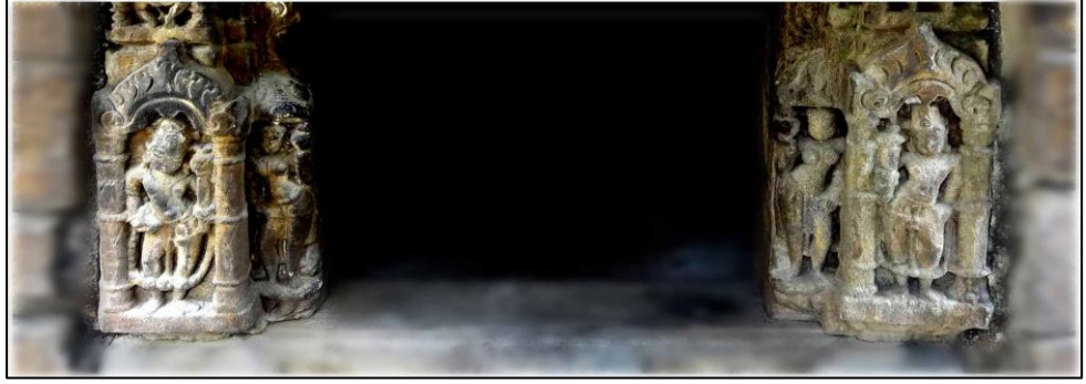
चित्र संख्या ७- गणेश मंदिर की द्वार शाखा का अंकृत पेट्ट्य भाग.

भाग विशेष उल्लेखनीय है, जिसमें सबसे बाहर शैव और वैष्णव द्वारपालों का अंकन है, इसके साथ ही अन्दर की शाखा पर कलशधारिणी मकरवाहिनी गंगा तथा कुर्मवाहिनी यमुना की त्रिभंग मुद्रा का अंकन भी दर्शनीय है, साथ ही द्वार के दायें पार्श्वस्तम्भ पर शैव द्वारपाल का अंकन है, जो दायें हाथ में कपाल तथा बाएं हाथ में खटबांग लिए है। इसी प्रकार दूसरी ओर वैष्णव द्वारपाल को दायें हाथ में गदा व बाएं हाथ को कटि पर टिका हुआ दर्शया गया है. (चित्र ७)