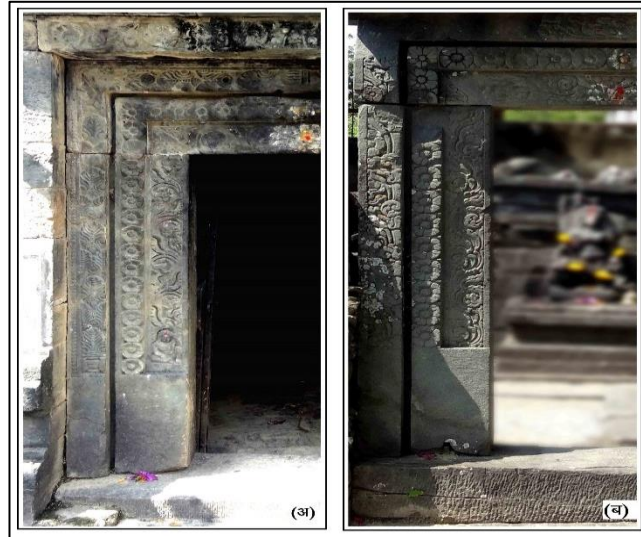
चित्र संख्या ५- (अ)पलेठी स्थित शिव मंदिर का दायां भाग (ब) अन्य मंदिर की द्वार भूषा.

शिव मंदिर के दांयी ओर एक भग्न मंदिर है. जिसका जंघा भाग व द्वार सुरक्षित है. इस मंदिर में एक सूर्य मूर्ति तथा एक पार्वती देवी (?) की मूर्ति रखी गयी है. इसलिए यह निर्दिष्ट करना कठिन है कि. यह मंदिर किस देवता या देवी को समर्पित रहा होगा, इस मंदिर का द्वार भी त्रिशाखा युक्त पूर्वाभिमुख है, द्वार का उदुम्बर सादा है. तथा पार्श्वस्तम्भों का पैद्य भाग भी अलंकरण विहीन है. पार्श्वस्तम्भों में अंदर से बाहर क्रमशः तीन शाखाएं पत्र शाखा, पुष्पशाखा तथा पत्रपुष्पशाखा है. पत्रशाखा के बाद पुष्पशाखा में १८ पद्म पुष्प हैं. तथा सामान्य अंतराल के बाद पत्रपुष्प शाखा है. पत्र पुष्पशाखा के ऊपरी भाग के मध्य में एक कीर्तिमुख का अंकन मिलता है. (चित्र ५ ब)