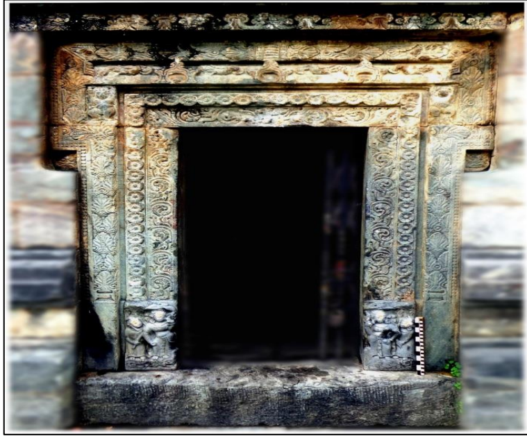
चित्र संख्या २ -पलेठी सूर्य मंदिर का अलंकृत द्वार

अर्थात् मंदिर के द्वार की जीतनी चौड़ाई हो उसके दुगुनी उसकी उंचाई रखनी चाहिए,और द्वार को बहुत ही सुन्दर और सोभायमान बनाना चाहिए. ७