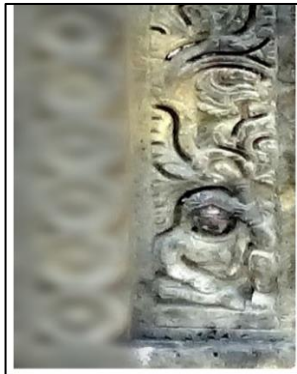
चित्र संख्या ४-शिव मंदिर पलेठी की द्वार भूषा पर अंकित कल्पवल्ली पकड़े हुए यक्षी

पुर्वोलिखित है कि, इस परिसर में चार मंदिरों के साक्ष्य हैं, जिनमे मात्र सूर्य मंदिर के अलावा शिव मंदिर पूर्णतः सुरक्षित है. जो की सूर्य मंदिर के ठीक पीछे स्थित है. यह मंदिर भी फांसणा शैली में निर्मित है. इस मंदिर के शिखर पर आकाश लिंग तथा गर्भगृह में स्थापित एक मुखी शिवलिंग की उपस्थिति इसके शिवमंदिर होने की पुष्टि करते हैं. इस मंदिर का द्वार भी त्रिशाखा युक्त पूर्वाभिमुख है. तथा द्वार का उदुम्बर भी सूर्य मंदिर की भाँति अलंकरणविहीन नितांत सादा है. साथ ही इसके पार्श्वस्तम्भों के पैद्य भी अलंकरण विहीन हैं. पार्श्वस्तम्भों की त्रिशाखाएं अंदर से बाहर की ओर क्रमशः कल्पवली शाखा, पुष्प शाखा तथा श्रीवृक्ष शाखा हैं, कल्पवली शाखा को एक देवी अथवा यक्षी की नाभि से संवर्धित दिखाया गया है, जिसे देवी/ यक्षी ने अपने एक हाथ से पकड़ा हुआ है. (चित्र ४)