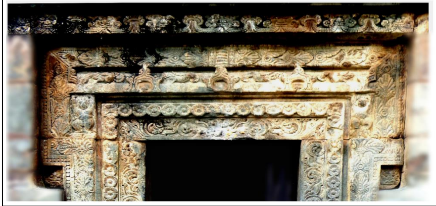
चित्र संख्या ३- पलेठी सूर्य मंदिर के द्वार का ऊपरी भाग